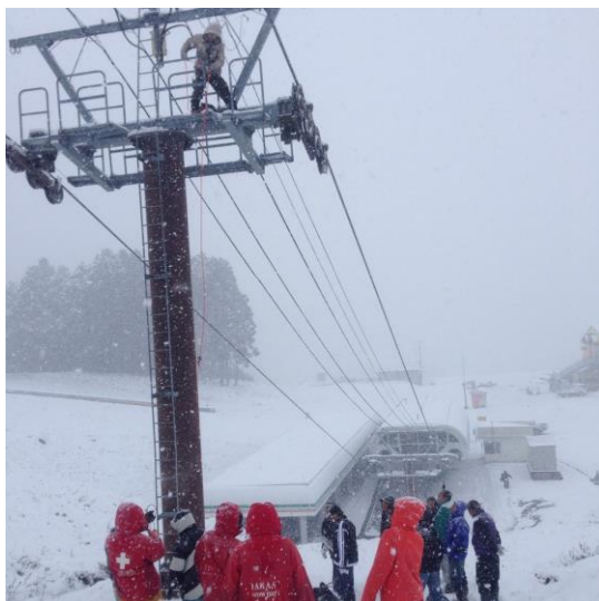
救助訓練のようす